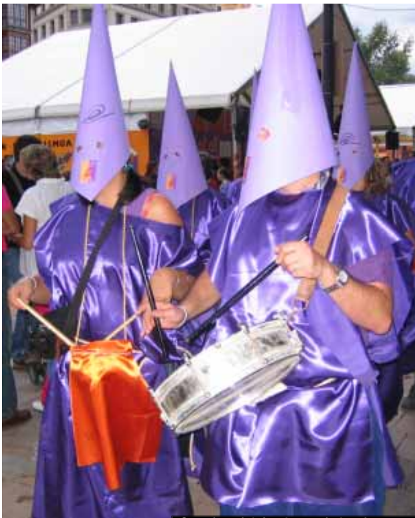
Gure jantziak jende guztia harritu zuen

Pozik gelditu ginen baina euskararen aldeko ekitaldia indartu behar da eta datorren urtean kontu alaiago bat antolatu.