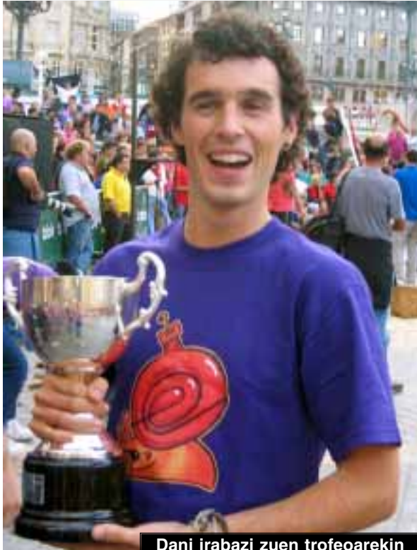
Dani irabazi zuen trofeoarekin

bigarren postua ezin izan genuen berdindu.