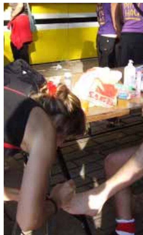
Hau Pittu Hau-ren esteti