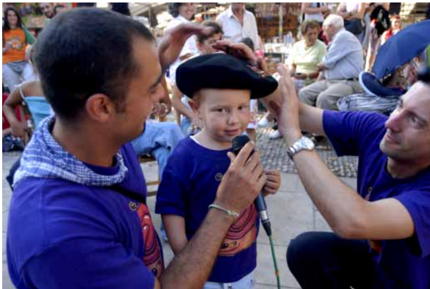
Oierrek txapela jasotzen du Peruren eskutik