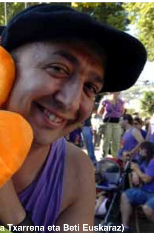
a Txarrena eta Beti Euskaraz)

gi berriak egon ziren; hain zuzen ere, ena» eta «Konpartsakide Berririk ez hurren. Noski, betikoek ere jaso alaririk Txarrena», iaz bezalaxe, eta Txarrena» eta, lehenengoz, «Beti berriz, «Langileena» saria jaso zuen.