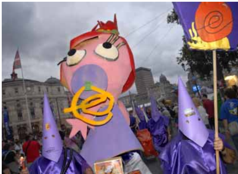
Mintzoa izan zen gure patrioaren irudia

Aste Nagusia jaietarako ez ezik aldarrikapenerako garaia ere bada. Mota guztietako ekitaldiak egiten dira, manifestazioak, kalejirak, kontzentrazioak eta era guztietako gaien alde, okupazioaren alde, presoen alde, ikurriñaren alde, zezenen