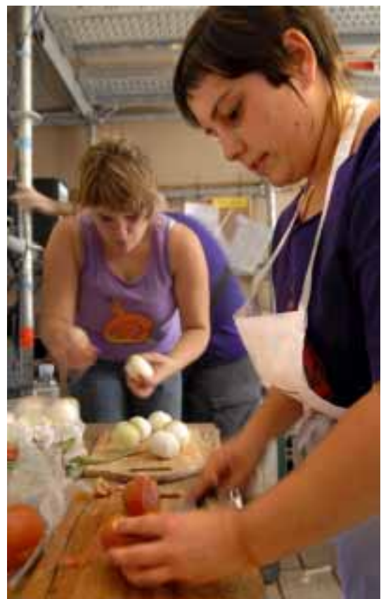
Konpartsakideak entsalada prestatzen

Hau Zorabio Hau-k asko nekatzen du, baina euskaldunak beti daude prest jaietan ibiltzeko. Horregatik, Plaza Berrira abiatu ziren marraskiloak jai giroa sortzeko Bertso Triki Kalejiran, urtero egiten duten bezala. Ekitaldi honetan Hau Pittu Hau-ren parte-hartzea ezinbestekoa da eta aurten ere ez zuen huts egin. Plaza Berrira heldu bezain pronto dantzatzen hasi ziren Hau Pittu Hau-ko kideak eta holan jarraitu ziren Bertso Triki Kalejira bukatu arte. Gero, atsedean txiki bat hartu zuten eta berriro dantzatzeari ekin zioten