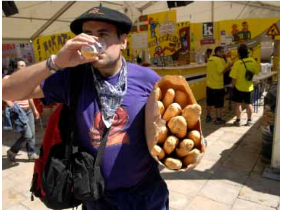
Dirudienez, edateak gose ematen du