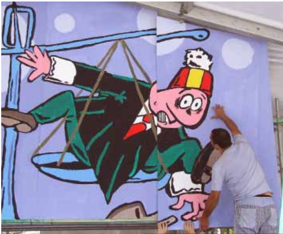
Pakok panelak jartzen ditu muntaketan