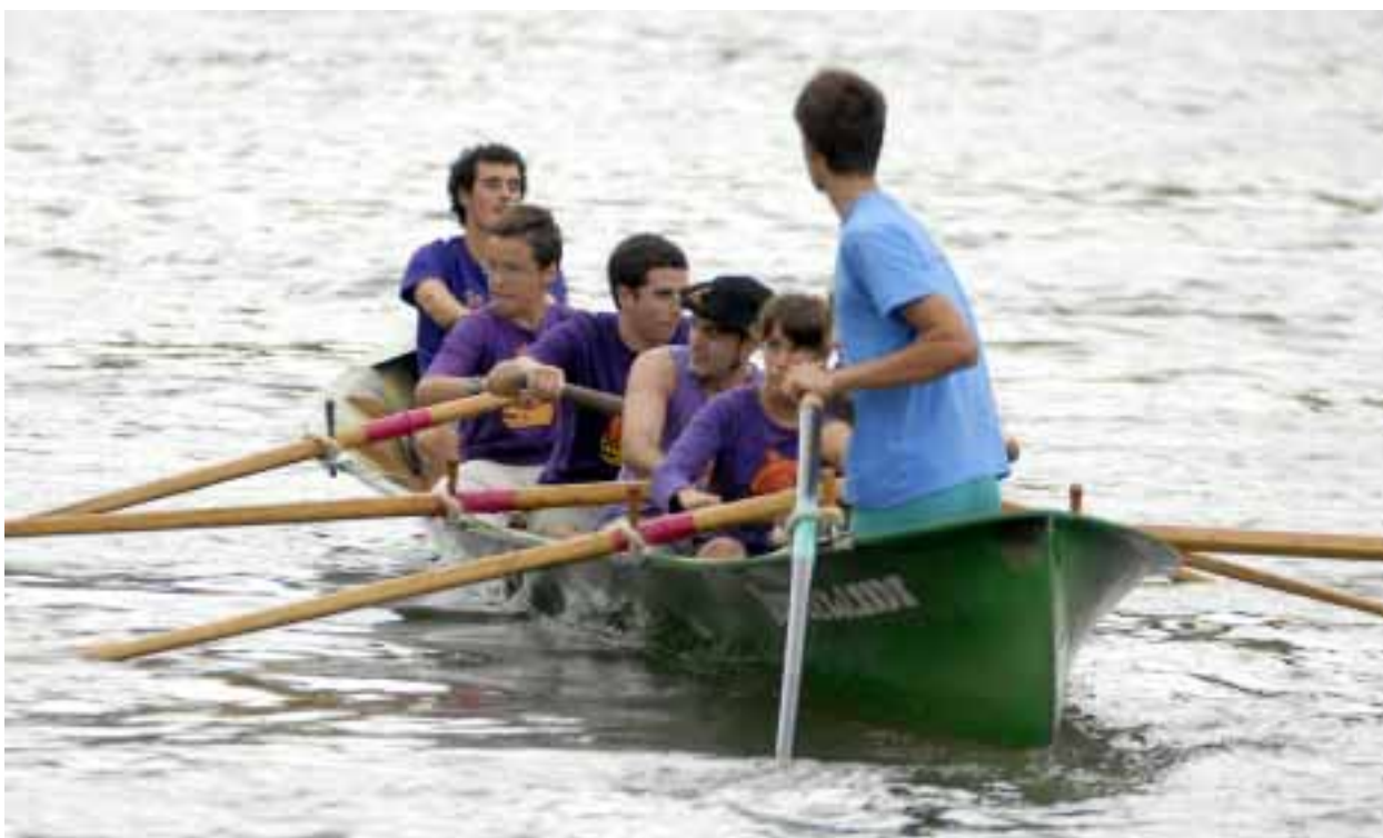
Ur Jokoetan ez ginen oso fino ibili

Aurten, Ur Jokoak arratsaldean egin zirenez, arazo gutxiago izan zituen Hau Pittu Hau-k talde bat osatzeko. Hala ere, ez genuen maila oso ona eman eta iaz lortutako