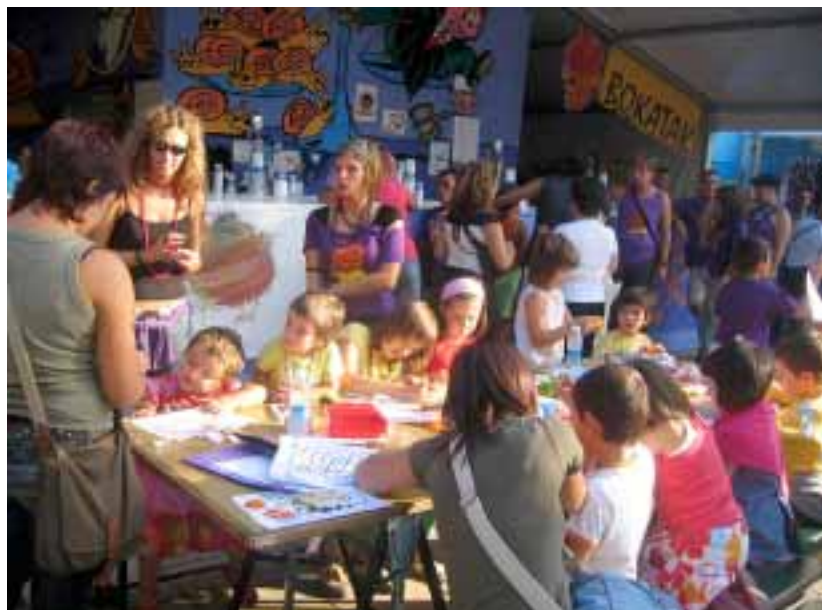
Arrakasta handia izan zuten umeentzako jolasak

Konpartsak web orrialdea indartzea erabaki zuen. Hedabide ona da gure konpartsaren informazioa zabaltzeko eta gutxiegi erabiltzen dugu. Horrexegaitik, hemendik aurrera gehiago landuko dugu gure web orrialdea.