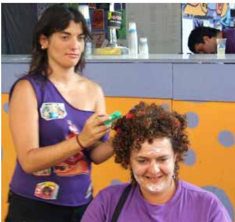
Konpartsakideek Hau Zorabio Hau jokua irabazteko proba bat betetzen

Hau Pittu Hau-ko kideek Euskal Guneko erromerian Amaiur taldearekin eta azken indarrak erre zituzten.