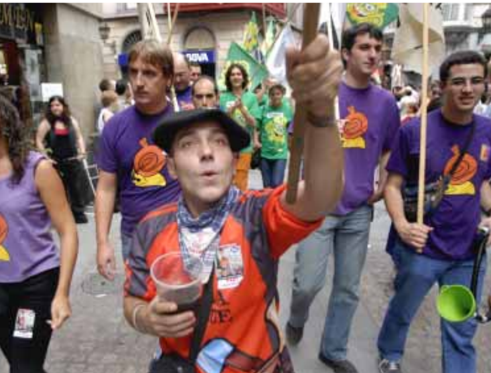
Konpartsek denetarik eraman zituen txupikalejirara

alde kalejira antolatu zuten Bilboko Konpartsek