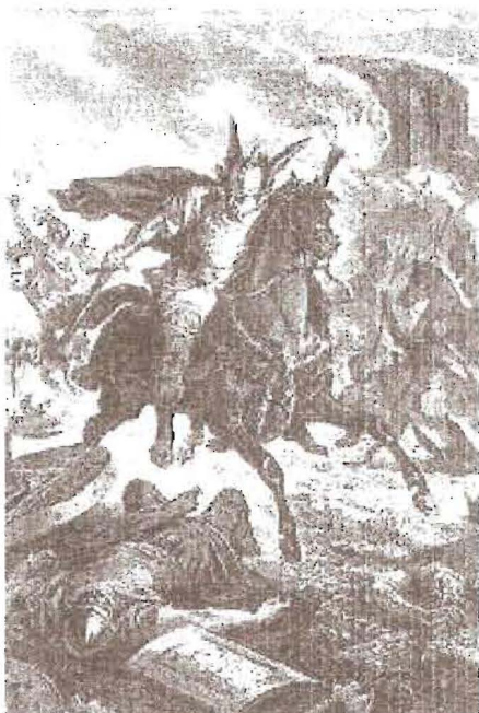
hau dun hau erromeria!