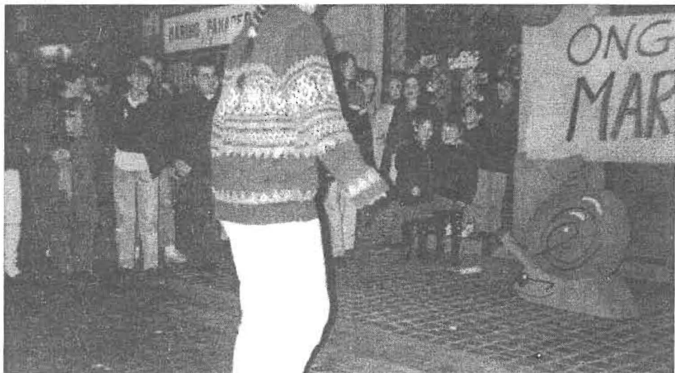
Eguzkiko bihotz apurtuak, Satorrakeko bahitzaileak, HPHko sasibertsolariak, eta Lizarran sines dezagun... Hor Dago!koak!!!

Bukatzeko, eta txantxak apur bat aldera utziz, gogoratu beharra daukagu haragiz eta ez gomaespumaz egindak dauden bahituak. Beraien sufrimendua benetazkoa da eta espero dugu, marrazkiloarekin egin dugun moduan, laster baten beraiek ere bere herrian, bertsolarien aurrean, lore sorta bat eskuan, gu guztion omenaldia jasotzen egotea.