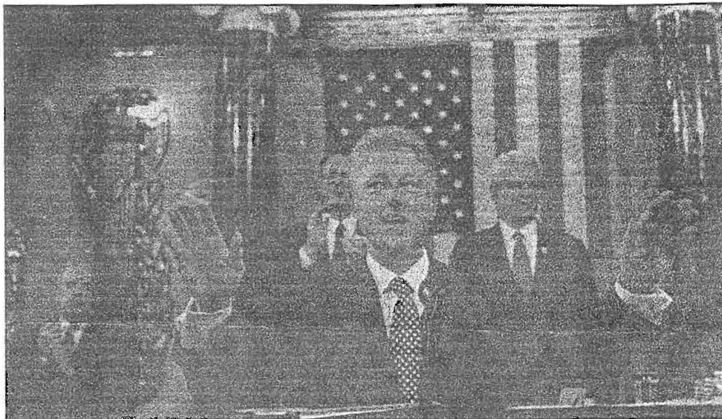
Clinton eta Sadam Hau Pittu Haun aritzea Nazio Batuen planaren barruan dago

H arrigarria da ze nolako ezberdintasun dauden herrien izakeren artean. Adibide moduan egin dezagun Euskal Herria eta Estatu Batuen arteko konparaketa bat. Bururatu Jose Antonio Ardanza Leioako Batzokiren militante bateri zakila erakutsi eta mamada